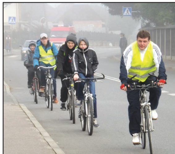
Młodzież wyruszała w trasę małymi grupami wraz z opiekunami