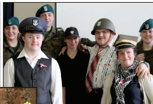
Wspólna fotografia podopiecznych SOSW na Turnieju Wiedzy i Tradycji Patriotycznej

Impreza miała za zadanie przybliżyć uczniom najważniejsze pieśni i piosenki, które towarzyszyły Polakom w ważnych i niejednokrotnie trudnych momentach historycznych. W regionie