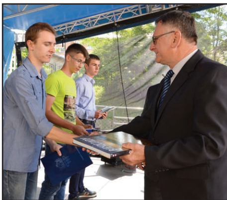
Wręczenie nagród w konkursie multimedialnym „Rozślawili Ziemię Brzozowską”

Ubiegłoroczne obchody Dnia Patrona Powiatu Brzozowskiego, który przypada na dzień 19 października, były okazją do ogłoszenia w powiecie brzozowskim roku pod hasłem „Taka będzie Rzeczpospolita jakie młodzieży wychowanie”, nad którym honorowy patronat objęła pani Prezydentowa Karolina Kaczorowska. Założenia tego roku były ambitne, a ich realizacja na pewno nie była łatwa. Chodziło bowiem o to, by miłość do Ojczyzny propagowana przez Patrona Powiatu Błogosławionego Księdza Jerzego Popiełuszkę stała się udziałem nas wszystkich,