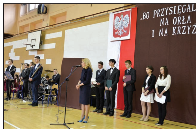
W I LO zorganizowano m.in. akademie poświęcone „Żołnierzom Wyklętym”...

W tym szczególnym roku chcąc przekazać młodzieży jak najlepsze wzorce bardzo dużo miejsca poświęcono osobie wybitnego Polaka, jakim był Papież Polak Jan Paweł II. Uczniowie ZSB wzięli udział w II Szkolnym Konkursie Wiedzy o Świętym Janie Pawle II, zaś I Liceum Ogólnokształcące tradycyjnie zorganizowało Konkurs Literacki „Młodzi a Jan Paweł II”, w którym co roku chętnie bierze udział młodzież szkół gimnazjalnych i ponadgimnazjalnych z terenu powiatu brzozowskiego. Szczególną wagę nauczyciele i wychowawcy położyli również na przypomnienie i utrwalenie wiadomości dotyczących patronów szkół, do których młodzież uczęszcza, (stąd akademie i okolicznościowe spotkania im poświęcone) oraz samego Błogosławionego Księdza Jerzego Popiełuszkę – Patrona Powiatu. Znajomością jego życia i działalności wykazali się młodzi ludzie biorący udział w Międzyszkolnym Konkursie organizo-