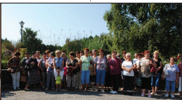
Wyjazd do Arboretum w Boleszycach