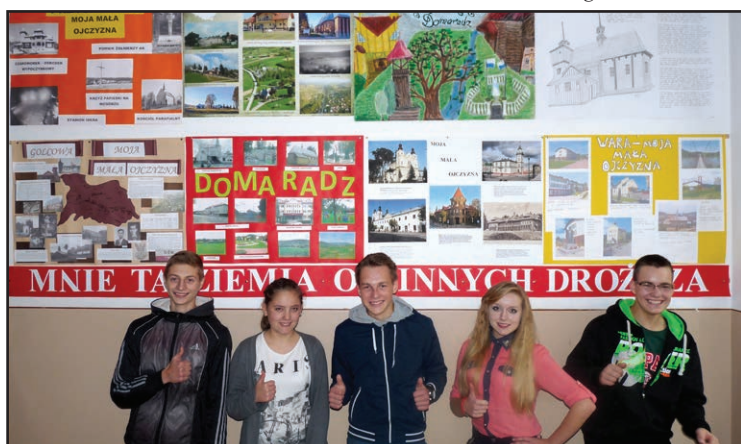
Szkolny konkurs plastyczny „Moja mała Ojczyzna” zorganizowany w Zespole Szkół Budowlanych