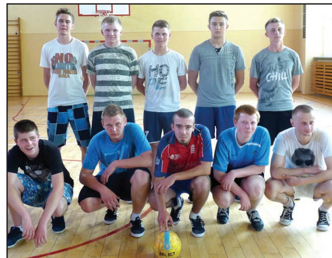
Pamiątkowe zdjęcie uczniów ZSB z Turnieju Piłki Halowej „Blżej sportu – dalej od narkotyków”