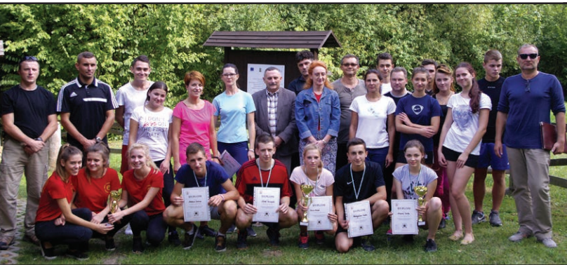
Pamiątkowe zdjęcie z jesiennego trójboju obronnego