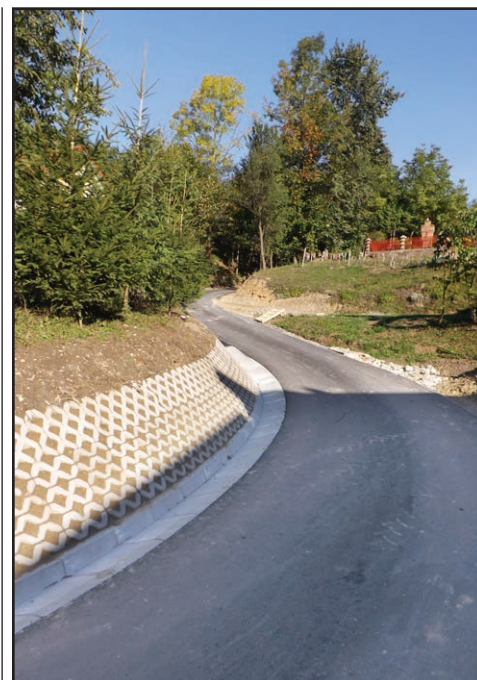
Nową nawierzchnię zyskała droga do przysiółka „Dobosówka”