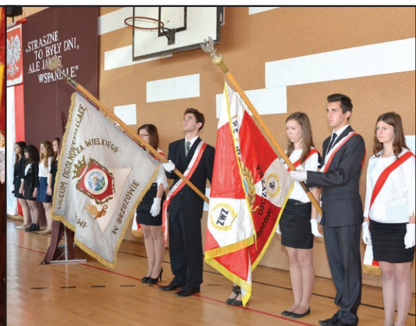
... a także bohaterom Powstania Warszawskiego