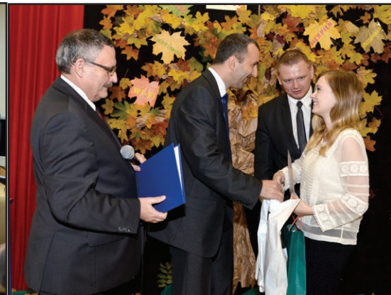
Wręczenie nagrody dla zwycięzcy najlepszego biznesplanu

wanym przez Zespół Szkół Ekonomicznych w Brzozowie. Uczniowie wszystkich szkół ponadgimnazjalnych i gimnazjalnych ziemi brzozowskiej mieli okazję wykazać się wiedzą i kunsztem literackim biorąc udział w konkursie pod nazwą „Manifest Pokoleniowy Młodego Polaka”. Jego celem było zachęcenie do kształtowania poczucia więzi emocjonalnej, społecznej i kulturowej z własnym narodem, z jego historią, tradycją i wartościami oraz utrwalenie poczucia dumy narodowej.