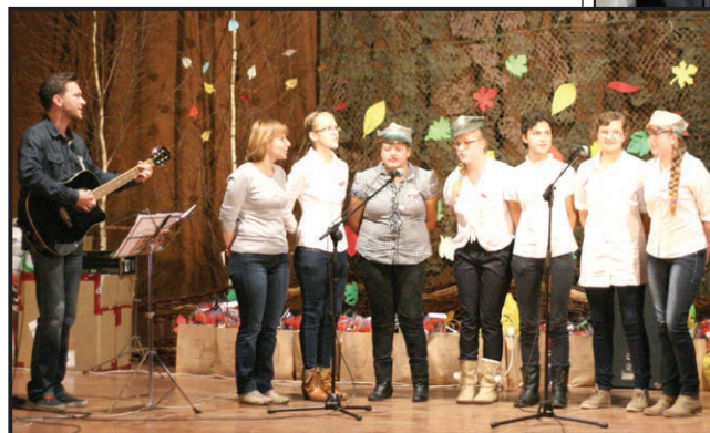
Uczniowie SOSW wzięli udział w Wojewódzkim Festiwalu Piosenki „Na Ojczystym Szlaku” w Rudniku nad Sanem

- w ramach zajęć koła plastycznego – fotograficznego działającego w internacie SOSW - zorganizowano Plenery fotograficzne. Efektem pracy wychowanków oraz wychowawców prowadzących zajęcia był między innymi udział w konkursie fotograficznym pod nazwą „Środowisko przyrodnicze naszych rzek i strumyków” oraz wystawa