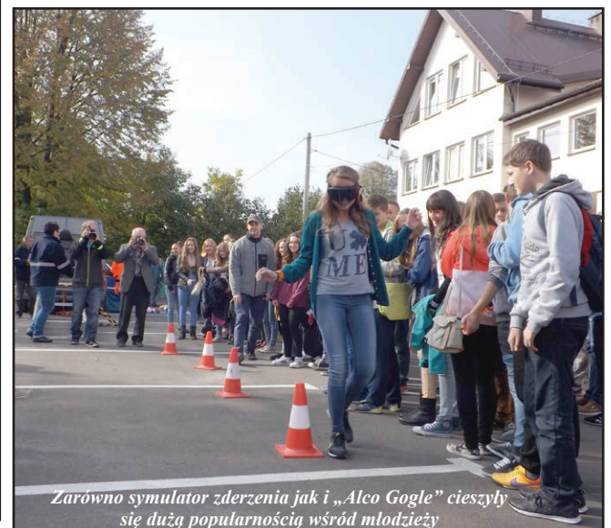
Zarówno symulator zderzenia jak i „Alco Gogle” cieszyły się dużą popularnością wśród młodzieży