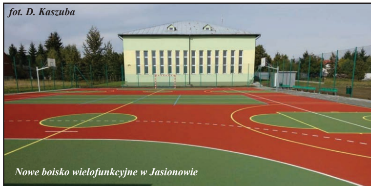
Nowe boisko wielofunkcyjne w Jasionowie