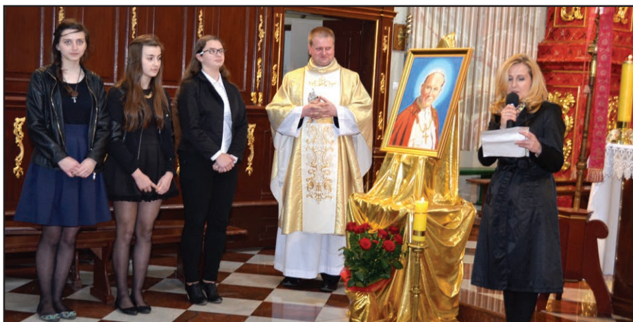
Rozstrzygnięcie Konkursu Literackiego „Młodzi, a Jan Paweł II”