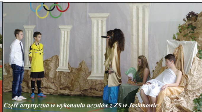
Część artystyczna w wykonaniu uczniów z ZS w Jasionowie