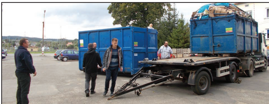
Zbiórka makulatury i puszek odbyła się w Starej Wsi ...