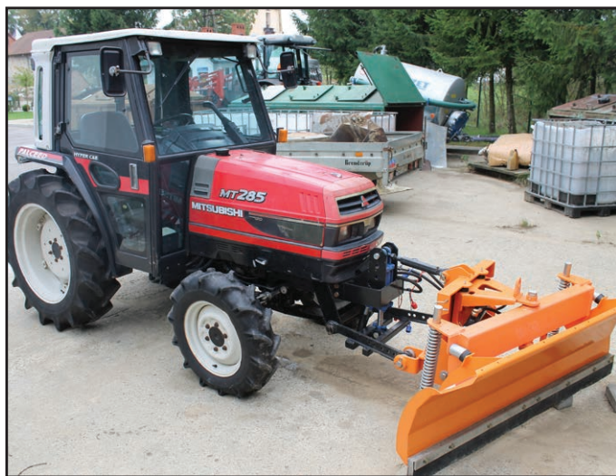
Nowy ciągnik z pługiem i piaskarką

W ramach przygotowań do zbliżającej się zimy władze gminy Domaradz zakupiły ciągnik z pługiem i piaskarką. Jego głównym zadaniem będzie odśnieżanie chodników.