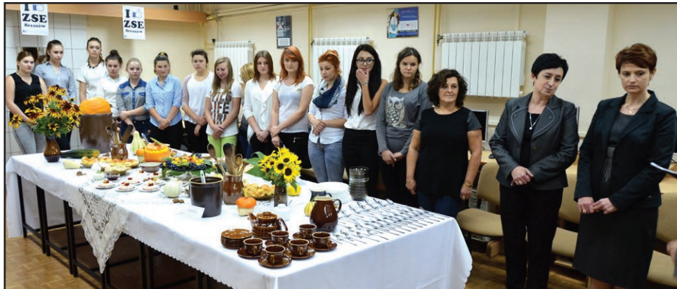
W ZSE przeprowadzono konkurs wewnątrzszkolny „Jarmark Przepisów Kulinarnych – Smaki Dzieciństwa”