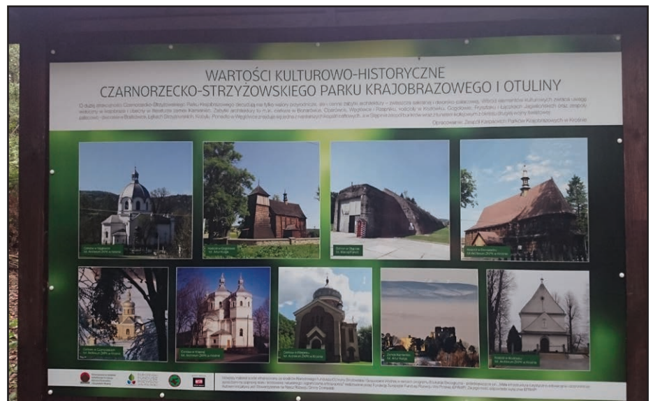
Tablice informacyjne zapraszają do zapoznania się z fauną i florą najbliższej okolicy