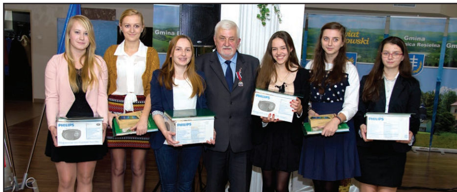
Laureaci konkursów „Manifest Pokoleniowy Młodego Polaka i Wiedzy o Patronie Powiatu Brzozowskiego” bl. Ks. Jerzym Popieluszcze wraz ze Starostą Brzozowskim

fotografii w bibliotece Ośrodka, a także w Bibliotece Pedagogicznej w Brzozowie. Nieco inny talent i umiejętności zdobyte podczas kursu florystycznego prezentowały podczas różnych imprez i spotkań uczennice Zespołu Szkół Budowlanych. Wykonane przez nie stroiki wielkanocne i ozdobne torebki przekazano mieszkańcom Domu Pomocy Społecznej w Brzozowie. Bardzo ciekawe inicjatywy pojawiły się w Zespole Szkół Ekonomicznych, gdzie przeprowadzono konkurs wewnątrzszkolny o nazwie „Jarmark Przepisów Kulinarnych – Smaki Dzieciństwa”. Uczniowie klas