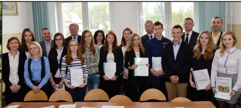
Jedną z podjętych inicjatyw w ZSE był konkurs na biznesplan pod hasłem „Moja firma moja przyszłość – pomysł na biznes w powiecie brzozowskim”.