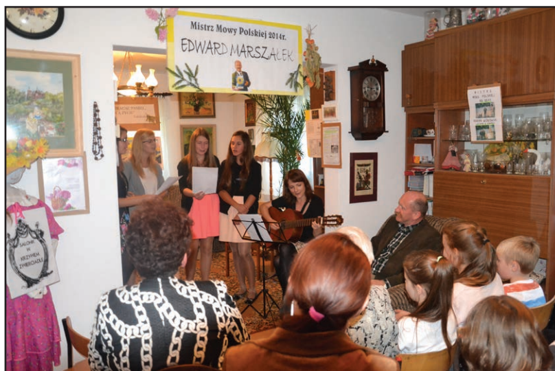
Występ wokalistek z zespołu „Mansarda”