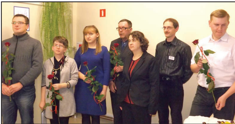
Na wieczorku poetyckim zrzeszeni w Ruchu Poetyckim „Zgrzyt” zaprezentowali swoje wiersze