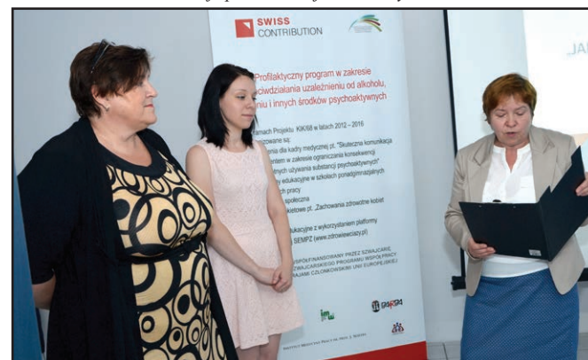
Najważniejsze wartości w życiu dorastającej młodzieży oraz prelekcje na temat uzależnień omawiały na spotkaniach pracownice PP-P w Brzozowie