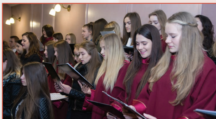
Chór działający przy Zespole Szkół Ogólnokształcących w Brzozowie

Piękną oprawę artystyczną mszy zapewnił chór działający przy Zespole Szkół Ogólnokształcących w Brzozowie pod batutą Krzysztofa Łobodzińskiego.