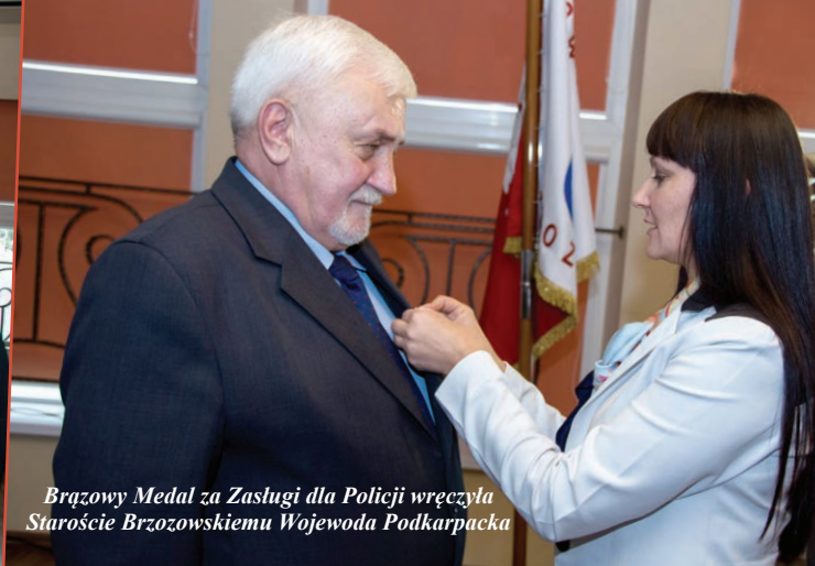
Brązowy Medal za Zasługi dla Policji wręczyła Staroście Brzozowskiemu Wojewoda Podkarpacka