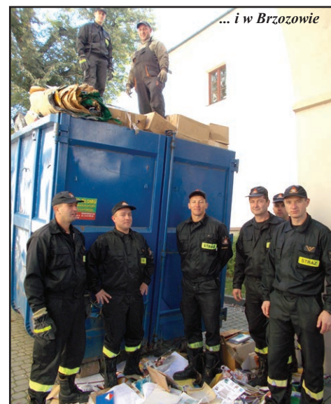
... i w Brzozowie

Największe podziękowania należą się jednak tym, którzy zebrali i dostarczyli makulaturę. Na pewno wszyscy pamiętają, jak Św. Jan Paweł II zwracał uwagę na misyjność kościoła. Obecny Papież Franciszek również prosi nas, byśmy pomagali sobie wzajemnie. Każdy z nas może wiele uczynić, nawet małym wysiłkiem, być misjonarzem, pomóc najbardziej, żyjącym w głodzie, bie-