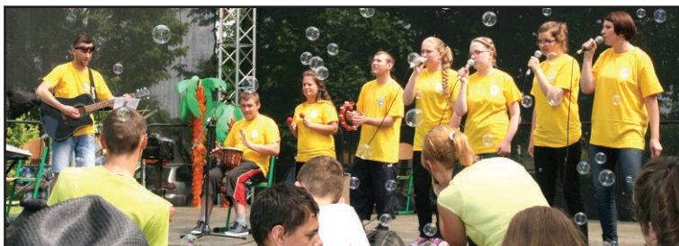
Międzynarodowy Festiwal Twórczości Dzieci i Młodzieży Niepełnosprawnej „Piosenka jest dobra na wszystko”

o profilu gastronomicznym wybrali wspaniałe przepisy i wykorzystując najciekawsze z nich - przygotowali smaczne tradycyjne dania. To, że młodym ludziom nie brakuje kreatywności i dobrych pomysłów udowodnili uczestnicy kolejnego konkursu realizowanego przez ZSE. Tym razem był to wewnętrzzszkolny konkurs na biznesplan pod hasłem „Moja firma moja przyszłość – pomysł na biznes w powiecie brzozowskim”. Efektem tej rywalizacji były trafne i ciekawe propozycje na rozpoczęcie działalności gospodarczej. Kulturowy dorobek Ziemi Brzozowskiej promował szkolny konkurs plastyczny „Moja mała Ojczyzna” zorganizowany w Zespole Szkół Budowlanych. Umiejętności recytatorskie zaś uczniowie tej szkoły prezentowali w konkursie poezji patriotycznej.