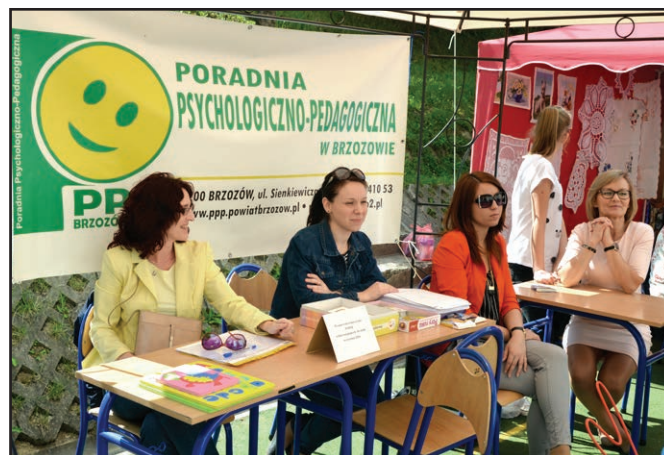
Panie z Poradni Psychologiczno-Pedagogicznej podczas Pikniku Rodzinnego przygotowały zabawy dla dzieci oraz udzielały porad dla rodziców