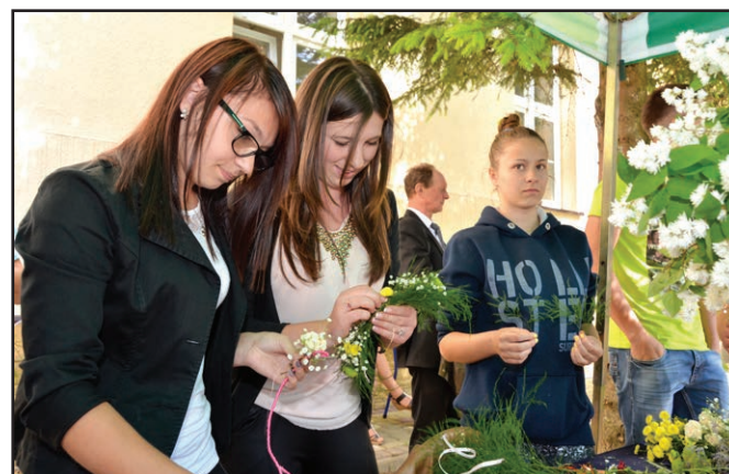
Uczennice ZSB prezentowały swoje umiejętności zdobyte podczas kursu florystycznego na Powiatowym Pikniku Rodzinnym